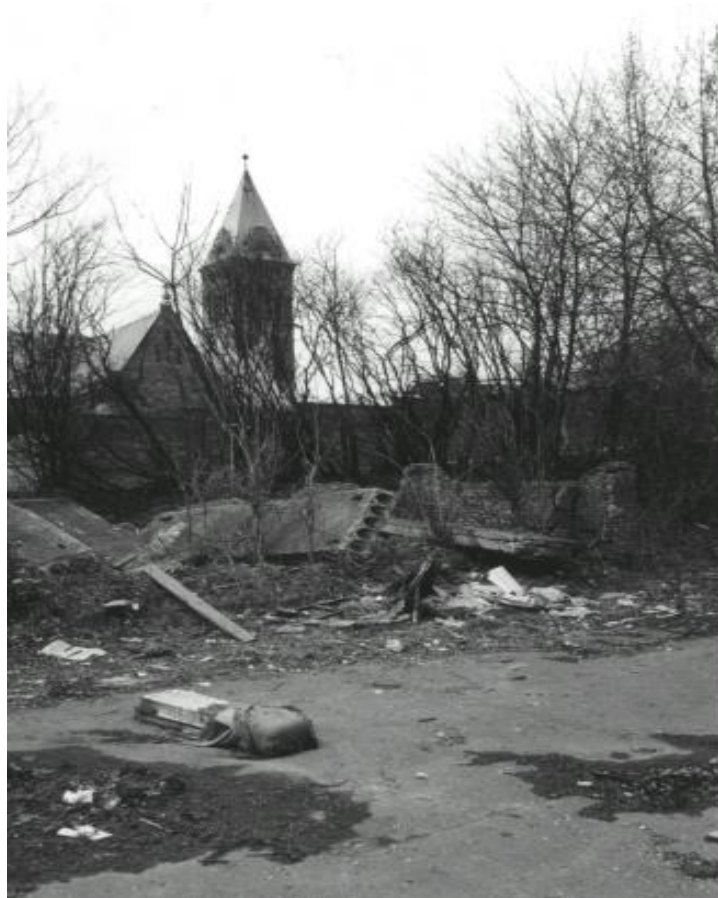
Rys. 3.3 Dzikie wysypisko w kamieniołomie Pod Wieżą Telewizyjną Fig. 3.3 Wild dump at the quarry By the TV Tower

Otoczenie kamieniołomu w zdecydowanej przewadze stanowią obiekty sportowo – rekreacyjne: KS Korona i Park Bednarskiego. Do tej grupy obiektów można byłoby też dołączyć kamieniołom Pod Wieżą Telewizyjną i otaczające błonia, wprawdzie obecnie jeszcze nie urządzone w tym kierunku ale użytkowane.