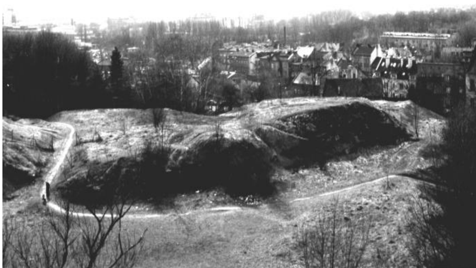
Rys. 3.2 Błonia otaczające kamieniołom Fig. 3.2 A meadow surrounding the quarry