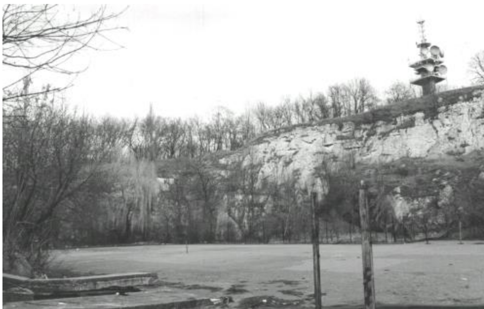
Rys. 3.1 Dawny kamieniołom Pod wieżą telewizyjną Fig. 3.1 Former quarry By the TV Tower